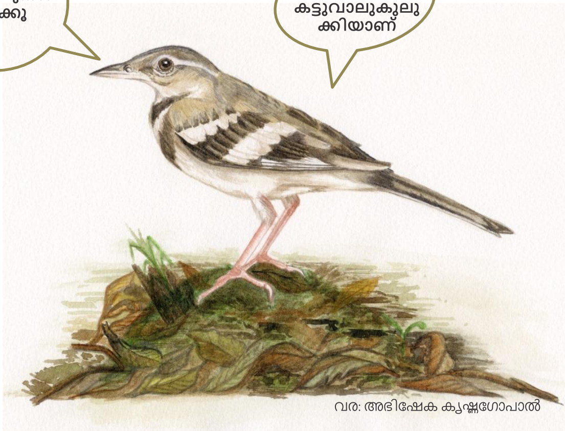
വര: അഭിഷേക കൃഷ്ണഗോപാൽ